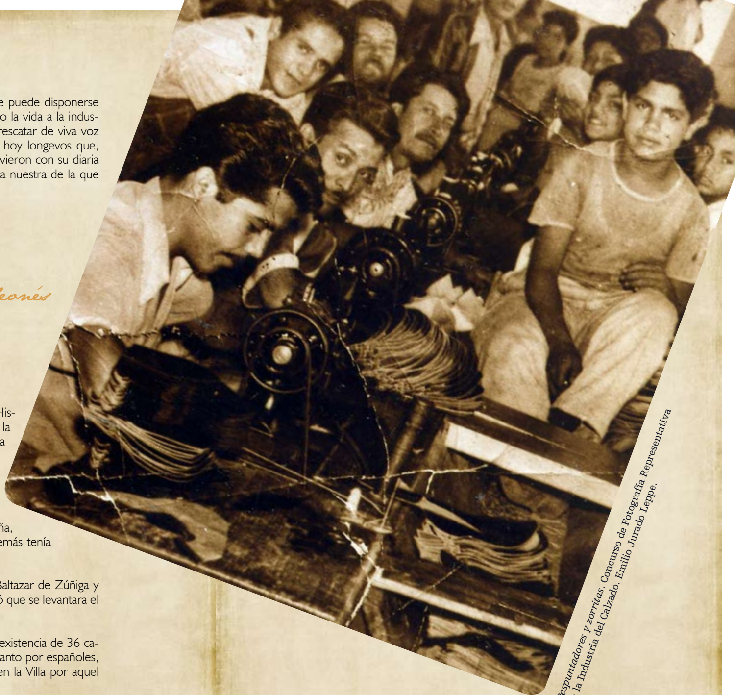
Pespuntadores y zorritas. Concurso de Fotografía Representativa de la Industria del Calzado. Emilio Jurado Leppe.

Entre 1808 y 1809, los zapateros leoneses comenzaron a constituirse como gremio. Muchos años atrás, en 1765, lo habían hecho ya tejedores y curtidores.