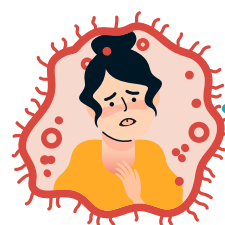
Insuficiencia respiratoria aguda