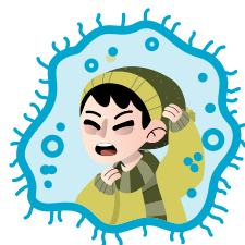
Dolor de garganta